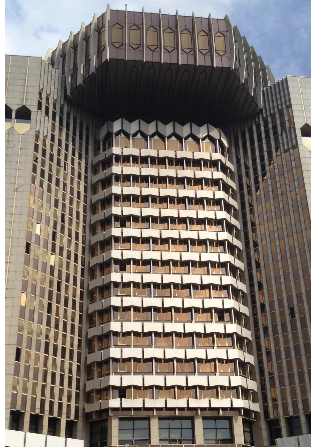
Hauptquartier der Zentralafrikanischen Zentralbank (BEAC) in Jaunde

Kamerun ist zwar nicht selbst direkte Zielscheibe des internationalen islamistischen Terrorismus, doch von den Auswirkungen solcher Bewegungen in den benachbarten Regionen betroffen. Vor allem im äußersten Norden des Landes (am Tschadsee) besteht seit Jahren ein hohes Entführungsrisiko für Ausländer durch Terrorgruppen. Auch das Grenzgebiet zur Zentralafrikanischen Republik gilt wegen der Übergriffe bewaffneter Rebellen von dort als unsicher. Außerdem bestehen auf der Halbinsel Bakassi und Umgebung fortdauernde Sicherheitsprobleme. Und im Grenzgebiet zu Nigeria gibt es Übergriffe der dortigen islamistischen Terrorgruppe Boko Haram auf kamerunisches Gebiet. Daher beteiligt sich die kamerunische Regierung derzeit an einer regionalen militärischen Eingreiftruppe.